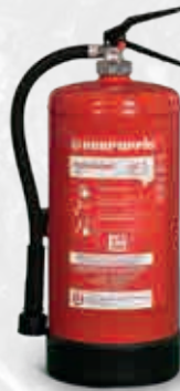
Constante-drukbrandblusser WD 9 F-500