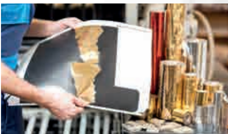
Verwerking van plastic en folie