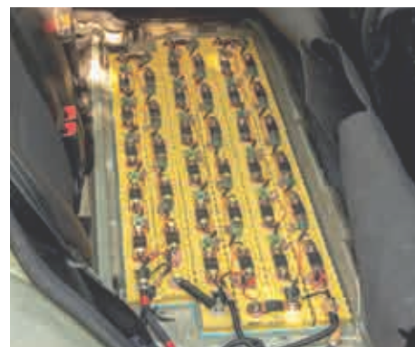
Grote en/of onbewaakte accuopslagplaatsen