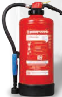
Blusser WA 9 F-500 met vloeistofpatroon

Een batterij met 182 cellen van een scootmobiel (celtype 18650), een grotere batterij dan de batterijen die over het algemeen worden gebruikt in apparaten als mobiele telefoons, laptops, elektrische gereedschappen, tuingereedschap, modelsporten (zoals afstandsbestuurbare auto's, boten, drones), en E-Bikes (waarvoor batterijen met 48 cellen worden gebruikt), is uitvoerig getest. Neuruppin creëerde twee verschillende draagbare blussermodellen van 9 l voor lithium-ion-batterijen t/m het geteste type batterij van 1890 Wh (51,1 V / 37 Ah).