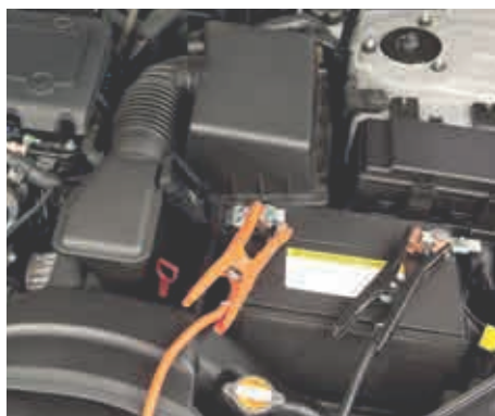
Accu's van elektrische auto's (capaciteit meer dan 15 kWh)