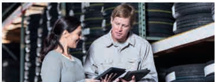
Productie, verwerking en opslag van rubber, inclusief banden.