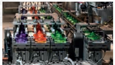
Productie, verwerking en opslag van kunststof F-500 beschermt ook kleine lastdragers/kunststof bakken.