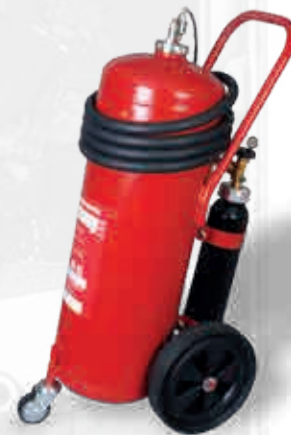
Verrijdbare brandblusser WA 50 F-500

Deze modellen bieden een superieure brandbeveiliging voor verscheidene lithium-ion-batterijtoepassingen, uiteenlopend van mobiele telefoons tot elektrische scooters. Bovendien is een verrijdbare brandblusser met een inhoud van 50 l verkrijgbaar voor meer gebruikersveiligheid (grotere hoeveelheid blusmiddel, langere blustijd).